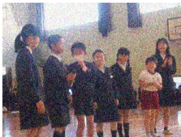
ふれあい集会での感想発表の様子