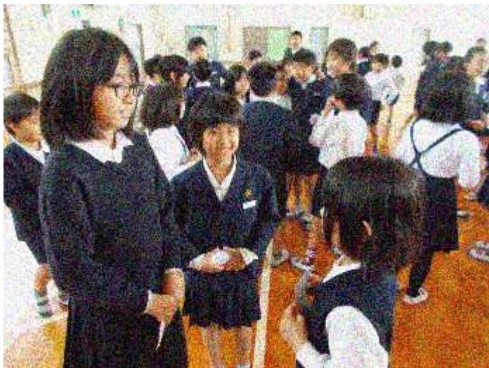
あいさつ集会でゲームをする子ども達

このように相手を思いやり、気配りや心配りができる子ども達が育っていることをたいへんうれしく思います。これからも学校や家庭、地域で、子ども達にこのような相手を思いやる優しい心を育てていきたいですね。