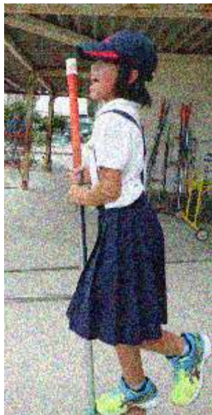
竹馬の片足乗りに挑戦 （3年生）

あと少しで達成という学年は、できるようになった子ども達が、まだ練習をしている友達に教えるようになることが大切です。全員達成した学年は、より難しい技や記録に挑戦してほしいと思います。そして、チームで目標に向かって努力する楽しさや充実感を味わってほしいと思います。