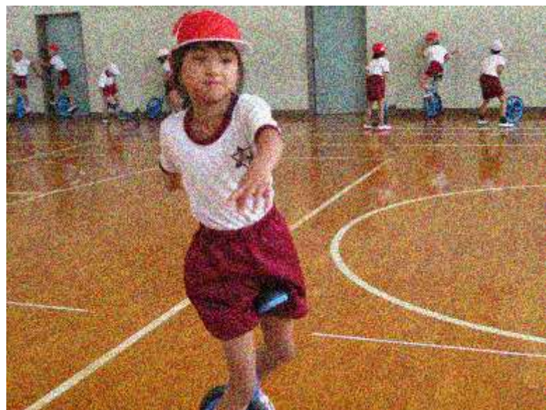
一輪車に乗れた（2年生）