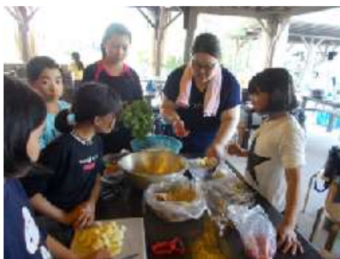
カレー作りの様子