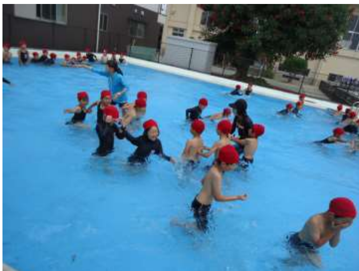
1年生の水泳の学習の様子

福岡県もいよいよ梅雨入りしましたので、天気が心配ですが、できるだけ水泳の学習の時間を設定したいと考えています。