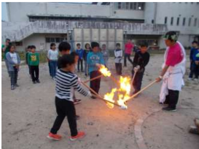
キャンプファイアーの様子

集団宿泊訓練では、「時間を守る」「室内や廊下では静かに過ごす」「気持ちのよい挨拶をする」「使った物はきちんと片付ける」など、集団で生活するときに必要なルールを守って生活できるようになることが大きなねらいです。子ども達は2泊3日の集団生活を通して、これらのルールの大切さを実感し、気持ちよく生活することができました。これからの生活に活かしてほしいと思います。保護者の皆様には、事前の準備や後片付け等、たいへんお世話をおかけいたしました。