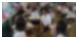
互いに高め合う子どもに