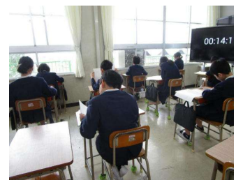
【真剣に取り組んでいます】